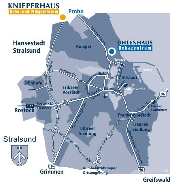
Layout/Fotos: Schwieger; Uhlenhaus; März 2009

E-mail: info@reha.uhlenhaus.de www.uhlenhaus.de