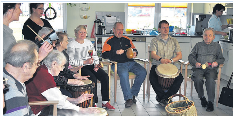
Musizieren in Gemeinschaft.

Wer alt wird, soll weiterhin mitten im Leben stehen. Durch unsere Arbeit in pflegerischen und sozialen Bereichen ist uns klar geworden, dass auf Grund der individuell und in unserem Sozialsystem begrenzten finanziellen Mittel, nicht alle Senioren eine vernünftige Teilhabe am Leben genießen können. An dieser Stelle ist es notwendig, durch ehrenamtliche und gemeinnützige Arbeit (z.B. durch Vereine), zu unterstützen. Dies ist unser Ziel. Dementsprechend möchten wir, Mitarbeiter der Memo Clinic® und der weiteren Unternehmen der Uhlenhaus® Group